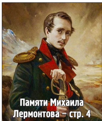
Памяти Михаила Лермонтова – стр. 4