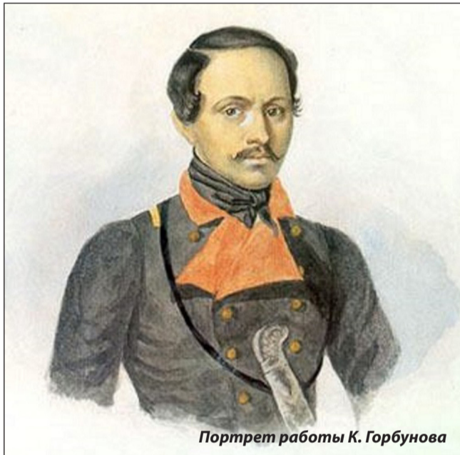
Портрет работы К. Горбунова

Он «влачил горький груз скептицизма через все свои мечты и наслаждения... К несчастью быть проницательным у него присоеди-