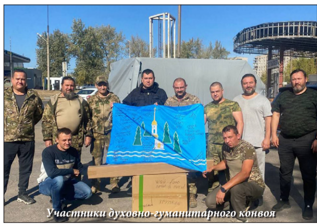
Участники духовно-гуманитарного конвоя

В с. Благодатное Волновахского района, где пока нет электричества и водоснабжения, помощь доставили в школу, Благодатенский храм и детский интернат.