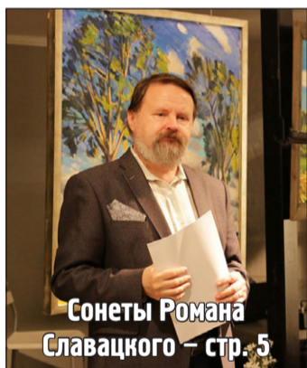
Сонеты Романа Славацкого – стр. 5