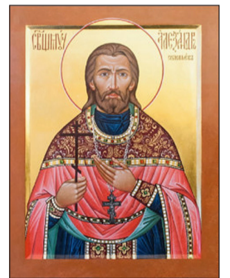
Священномученик Александр Соловьёв

Священник Александр Соловьёв родился в 1893 г. в с. Богородское под Коломной. Служил в храме с. Сладнево Волоколамского района. Пострадал за веру – был расстрелян в Бутово в 1937 г.