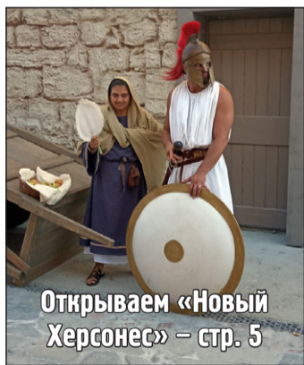
Открываем «Новый Херсонес» – стр. 5