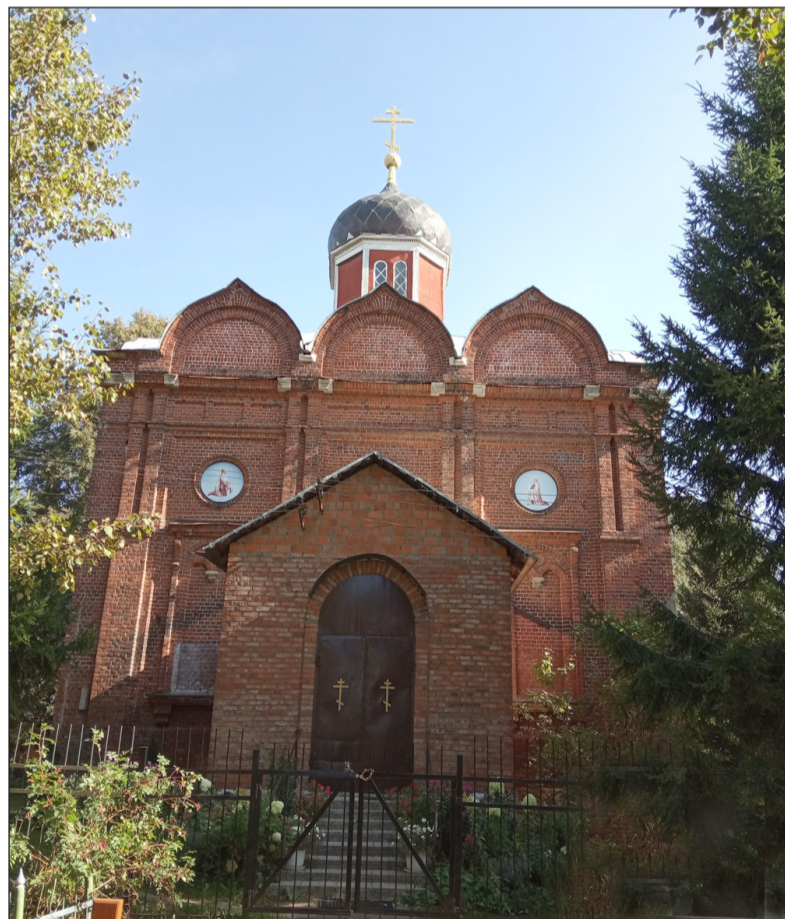
Покровская церковь сегодня

Из духовного звания. В Московской духовной семинарии окончил полный курс наук по 2 разряду в 1904 г.