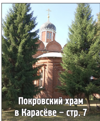
Покровский храм в Карасёве – стр. 7