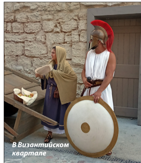
В Византийском квартале