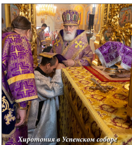
Хиротония в Успенском соборе

14 сентября митрополит Крутицкий и Коломенский Павел совершил