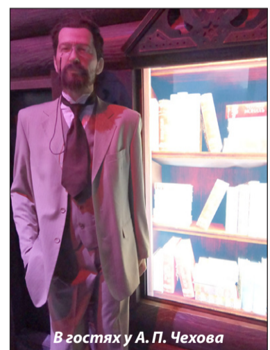
В гостях у А. П. Чехова

В зале «Херсонес» можно увидеть, как в небольшой греческой церкви совершается таинство венчания. В зале «Крымское ханство» можно услышать, как звучат народные