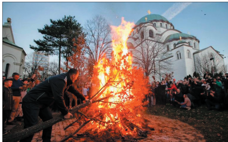
Сжигание бадняка в Сочельник

После Божественной литургии, принятия Таинства Евхаристии и поздравлений со светлым праздником люди идут по домам. И отмечают Рождество в кругу семьи.