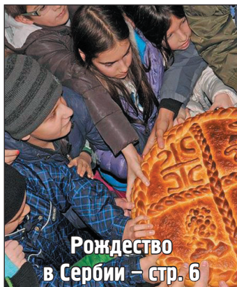
Рождество в Сербии – стр. 6