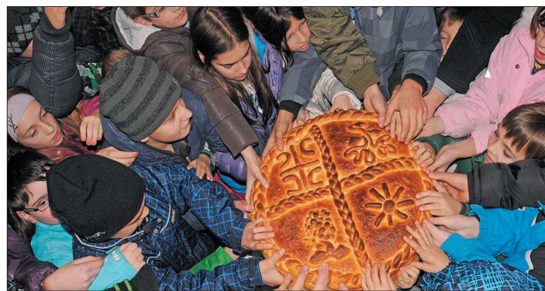
«Кусочек счастья» или «угощение»

Рождественская трапеза у сербов начинается с молитвы. После чего чесница разламывается (ни вилок, ни ножей употреблять не положено!) на несколько кусков — по числу присутствующих за столом. И раздаётся всем присутствующим. Смысл этого дарения в том, чтобы напомнить об ис-