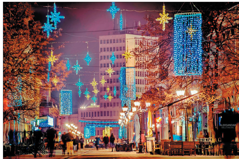
Святочная иллюминация в Белграде

ше в этот день перед восходом солнца люди шли в лес за «бадняком» — поленьем свежерубленного молодого дуба. Именно это дерево считается главным символом сербского Рождества. Оно обязательно должно присутствовать в доме православных сербов на Рождественские праздники. Бадняк символизирует полено, которое пастухи принесли в дар Иосифу для того, чтобы согреть холодные ясли, где родился Младенец Иисус. Ещё бадняк напоминает людям о кресте, на котором распяли Спасителя.