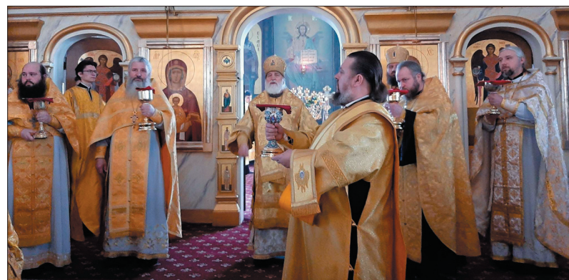
Праздник святителя Николая в Зарайске

В фойе конькобежного центра для всех участников образовательного форума была подготовлена тематическая