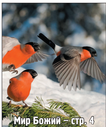
Мир Божий – стр. 4