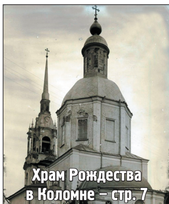
Храм Рождества в Коломне – стр. 7