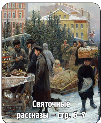
Святочные рассказы – стр. 6-7