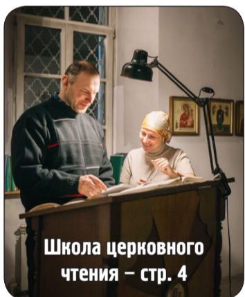
Школа церковного чтения – стр. 4