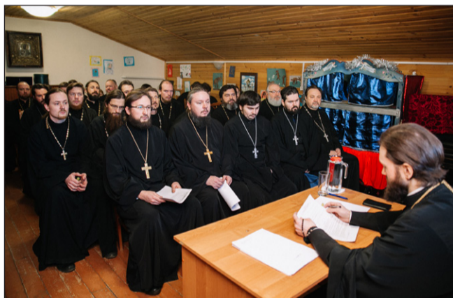
Собрание коломенского духовенства

20 декабря состоялось собрание духовенства благочиния города Коломны и Коломенского округа. Благочинный епископ Луховицкий Петр ознакомил собравшихся с циркулярами митрополита Крутицкого и Коломенского Ювеналия. Были рассмотрены меры по совершенствованию направлений церковного служения. Обсуждалась подготовка празднования Рождества Христова.