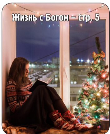
Жизнь с Богом – стр. 5