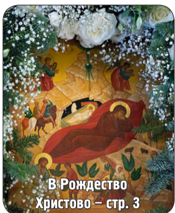
В Рождество Христово – стр. 3