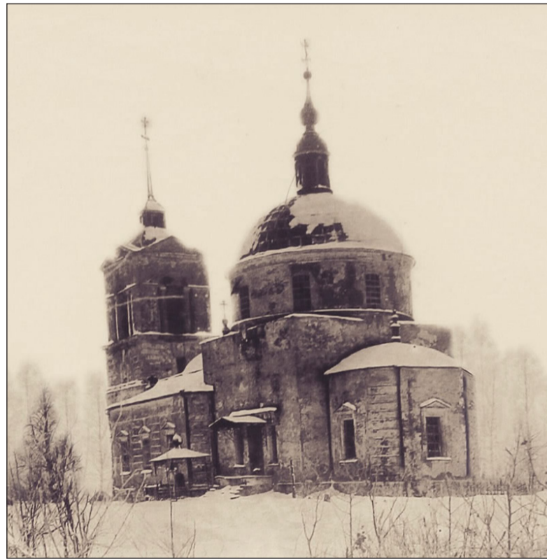
Так выглядел храм вскоре после закрытия

Опись церковному имуществу заведена с 1855 года, хранится в целости, проверена в 1910 году.