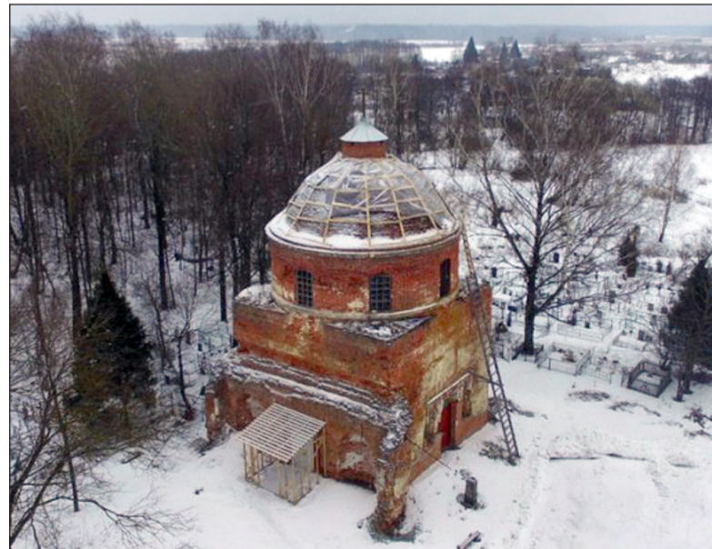
Никольский храм в наши дни

Содержания в год получает: казенного жалования 100 руб., процентов с причтового капитала 35 руб. 80 коп., от прихода за требоисполнение до 66 руб. 67 коп., от земли до 12 руб. 50 коп. Всего до 214 руб. 97 коп.