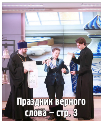
Праздник верного слова – стр. 3