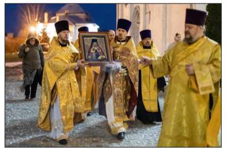
Встреча образа святителя Николая Японского