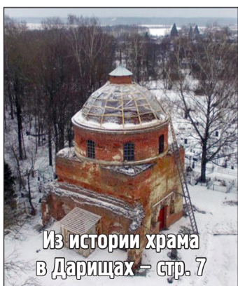
Из истории храма в Дарищах – стр. 7