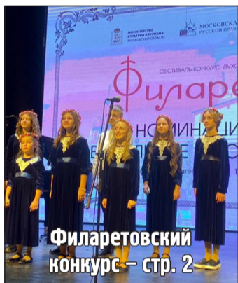
Филаретовский конкурс – стр. 2