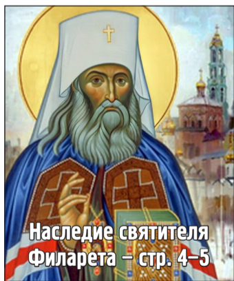
Наследие святителя Филарета – стр. 4–5